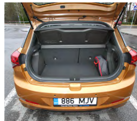
Pagasiruum on igapäevavajadusteks paras, mahtu saab tagaistmete arvelt kasvatada.