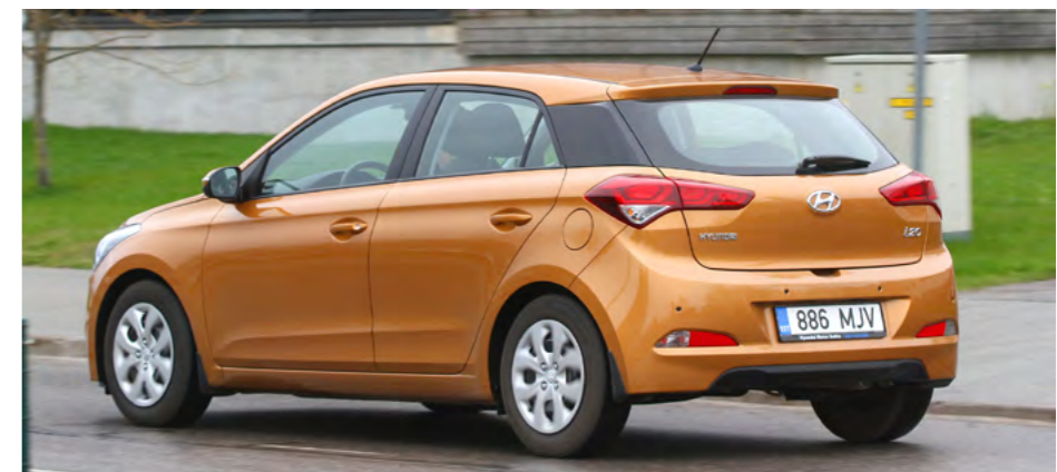
Piklikud tuled ja must C-piilar lisavad selge joonega välisdisainile vürtsi.

AUTOLEHE HINNANG i20 sobib teile, kui soovite väikeses kestas palju praktilisust ja häid sõidumadusi.