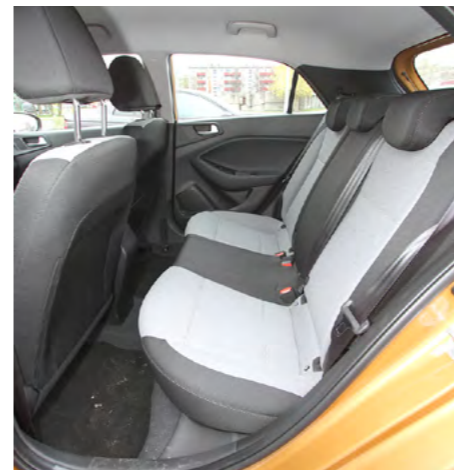
Tagaistmele mahuvad ära ka täiskasvanud.