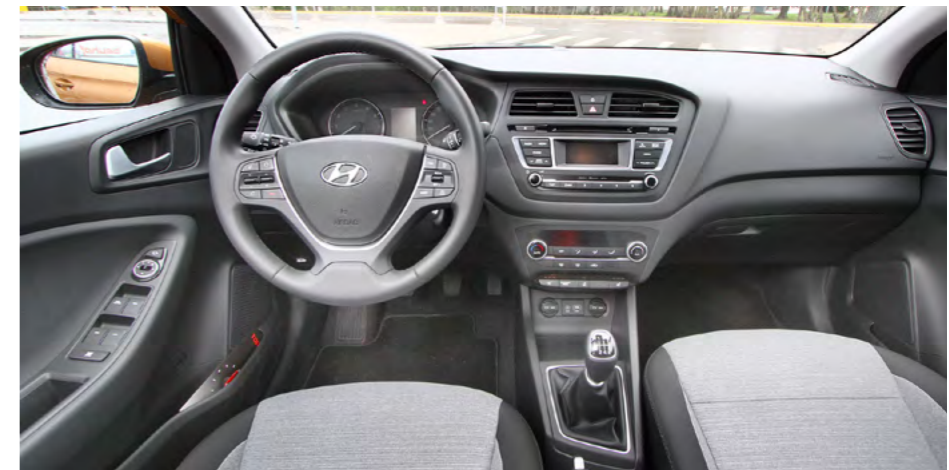
Hyundai i20 õnnestunud disain ja avar sõitjateruum jätab mulje suuremast autost.