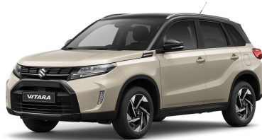
Savanna Ivory / Cosmic Black