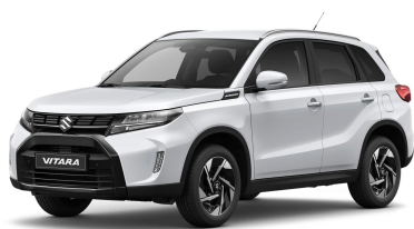
Cool White Metallic