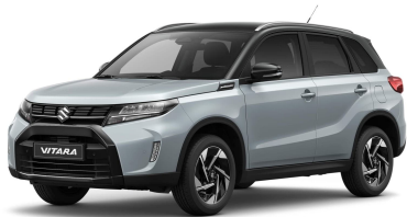
Ice-Grayish Blue / Cosmic Black