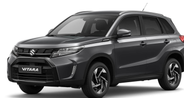
Titan Dark Gray