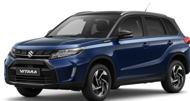
Sphere Blue Pearl / Cosmic Black