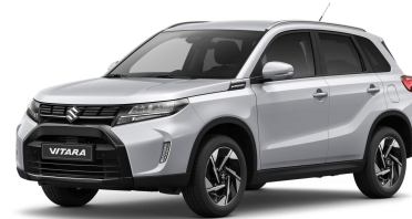
Silky Silver Metallic