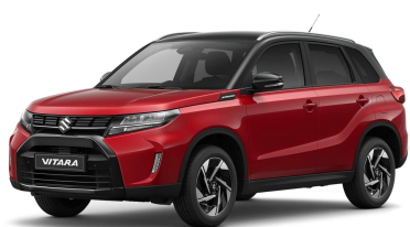
Bright Red / Cosmic Black