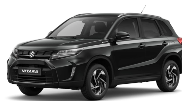
Cosmic Black Metallic