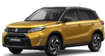
Solar Yellow / Cosmic Black