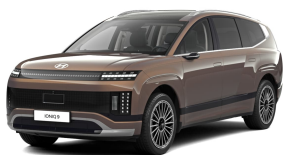
Sunset Brown Pearl

NB! Изображение автомобиля на фото носит иллюстративный характер. Оборудование машины, в т.ч. цвет крыши, корпусов зеркал, релингов, капсул на дисках, задних окон и пр. может изменяться в зависимости от оснащения машины.