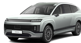
Celadon Gray Matte