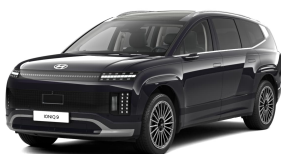
Biophilic Blue Pearl