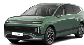
Ionosphere Green Pearl