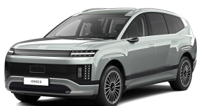
Celadon Gray Metallic