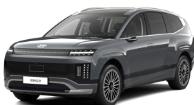
Nocturne Gray Metallic